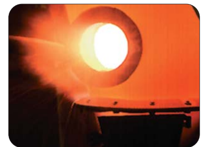
Wasser & Wärme